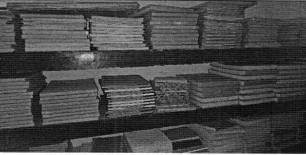
স্টোরে প্রয়োজনের অতিরিক্ত রেজিস্টার