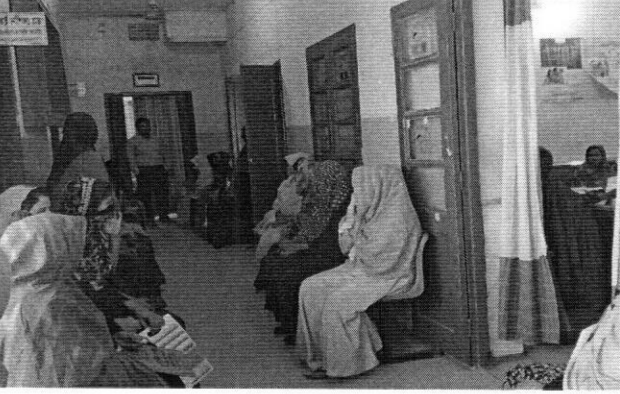
অপেক্ষমান রোগীদের বসার জন্য পর্যাপ্ত ব্যবস্থা করা হয়েছে