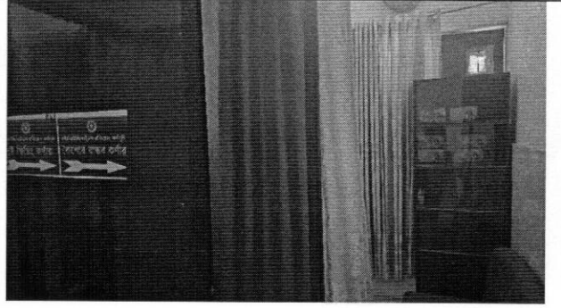
স্থানীয়ভাবে স্থাপিত ব্রেস্ট ফিডিং এবং কৈশোর বান্ধব কর্ণার